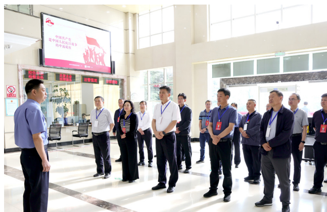
8月27日，曲靖市人大常委会开展市六届人大常委会第二十九次会议会前专题调研