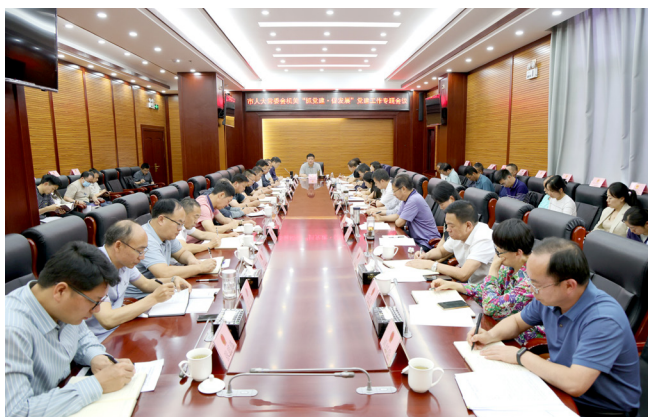
7月3日，曲靖市人大常委会召开机关“抓党建·促发展”党建工作专题会议