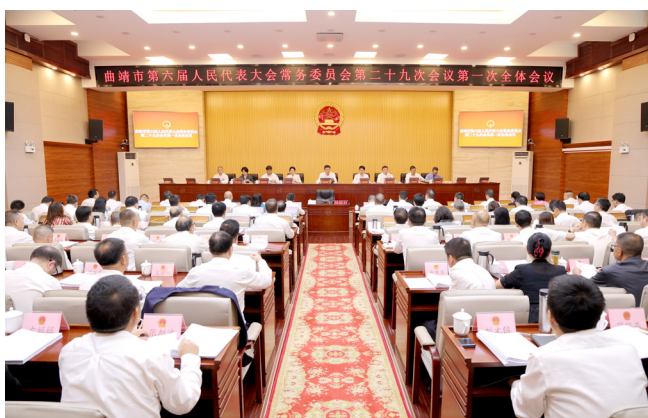
8月28日，曲靖市第六届人民代表大会常务委员会第二十九次会议举行第一次全体会议