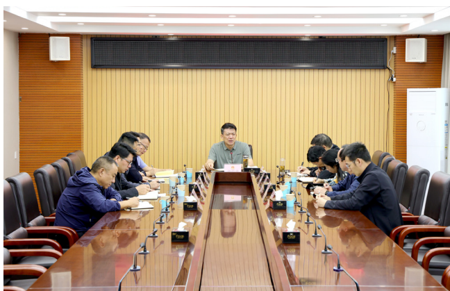
8月23日，曲靖市人大常委会召开全市人大系统防汛工作紧急会议