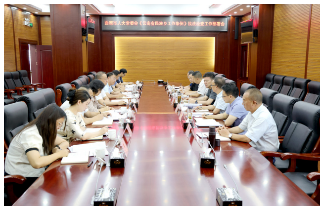
7月17日，曲靖市人大常委会召开《云南省民族乡工作条例》执法检查工作部署会