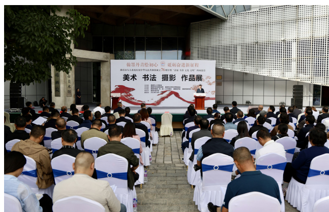
9月28日，曲靖市人大系统庆祝中华人民共和国成立76周年暨“清廉、书香、文化、文明”四项建设“美术、书法、摄影”作品开展展