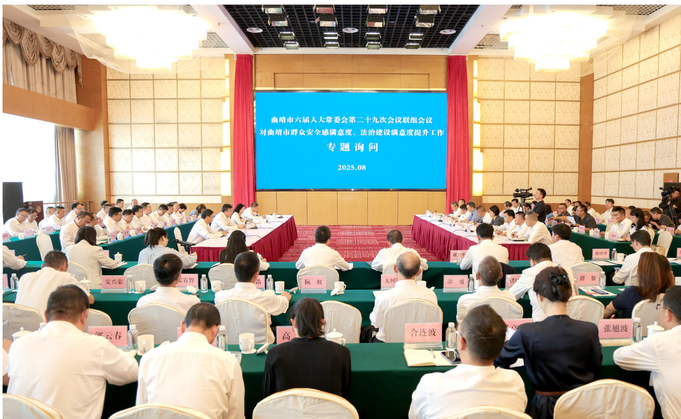
8月29日，曲靖市六届人大常委会第二十九次会议召开联组会议，对全市群众安全感满意度、法治建设满意度提升工作开展专题询问。