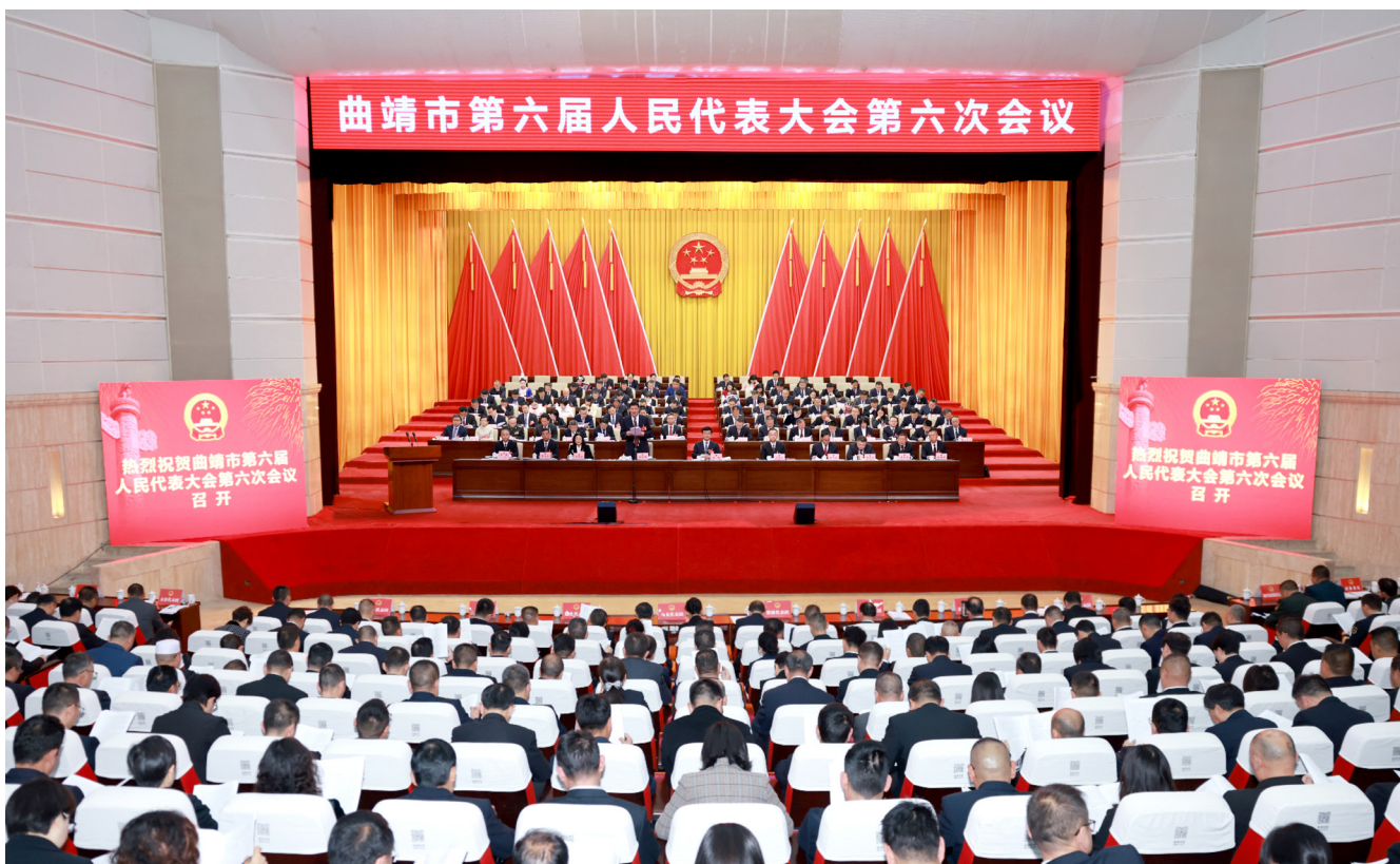
2月26日，曲靖市第六届人民代表大会第六次会议在曲靖会堂隆重开幕。