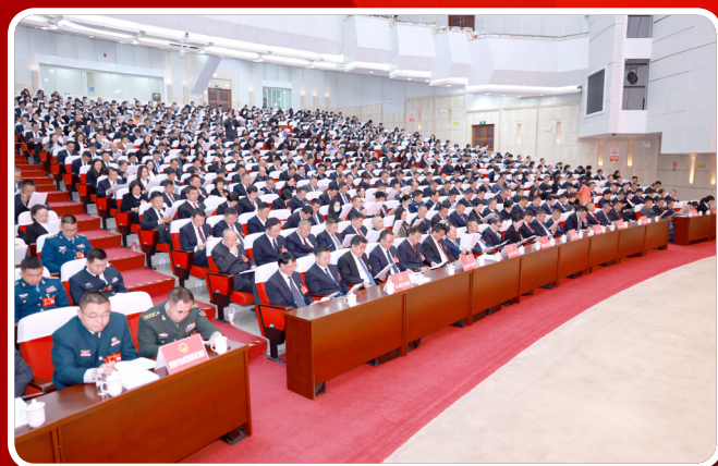
2月26日，在曲靖市第六届人民代表大会第六次会议第一次全体会议上，人大代表认真听取政府工作报告。