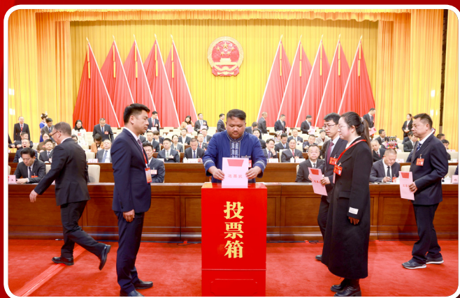
3月1日，曲靖市第六届人民代表大会第六次会议举行第三次全体会议，以无记名投票方式进行选举。