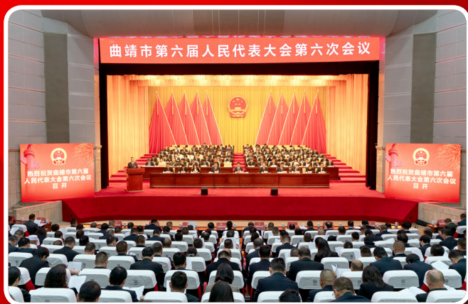
2月26日，曲靖市第六届人民代表大会第六次会议在曲靖会堂隆重开幕。