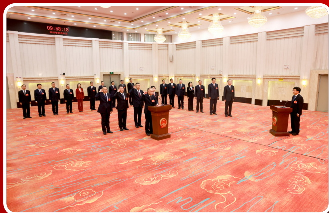
3月1日，在曲靖市第六届人民代表大会第六次会议第三次全体会议后举行了宪法宣誓仪式。