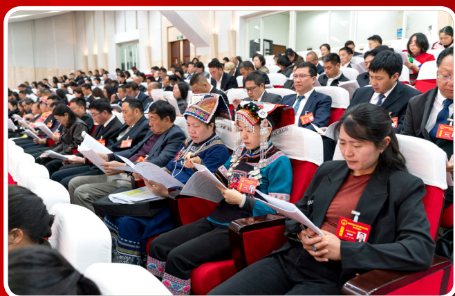
2月26日，在曲靖市第六届人民代表大会第六次会议第一次全体会议上，人大代表认真听取政府工作报告。