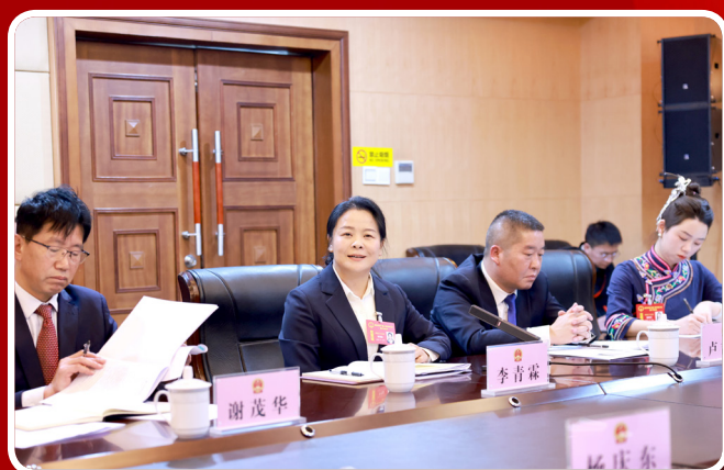
2月26日，人大代表认真参与代表团分组审议，积极建言献策、共话发展。